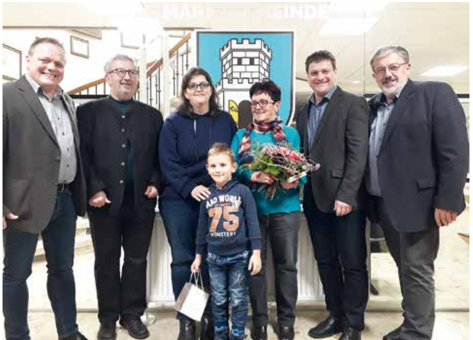
Die Uttendorfer G'schäftsleut bedanken sich sehr herzlich für Ihren Einkauf

Alle weiteren Gewinner wurden schriftlich verständigt und können die Preise noch bis 30. April 2019 im Schuhhaus gehvital by margit seidl abholen.