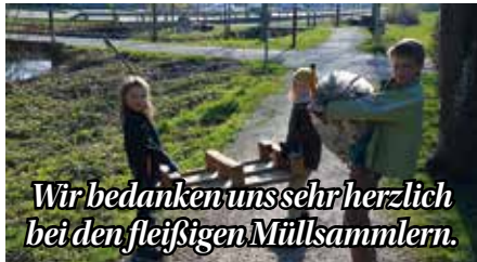
Wir bedanken uns sehr herzlich bei den fleißigen Müllsammlern.

Müll, der zu Hause anfällt, ist auch zu Hause in der eigenen Abfalltonne zu entsorgen! Die Müllsäcke der Firma Gradinger können jederzeit im Gemeindegam gekauft werden.