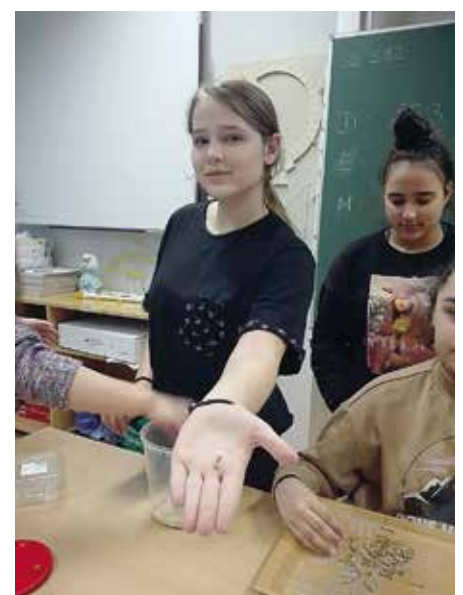
(Hinweis: Diese Fotos wurden vor den Corona-Bestimmungen aufgenommen)