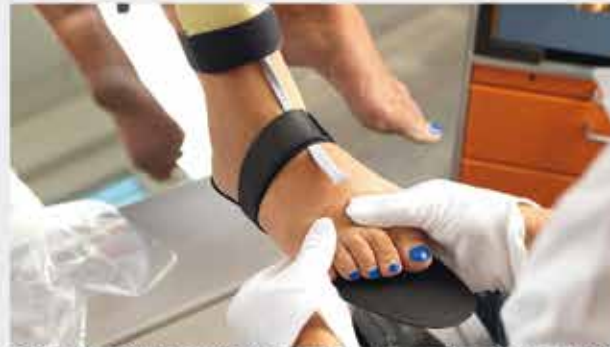
Die maßgefertigten Einlagen von Jurtin werden direkt am Fuß modelliert und sind sofort zum Mitnehmen.

Wir gehen mit einer Selbstverständlichkeit davon aus, dass die Füße zu funktionieren haben, ohne dass wir uns besonders um sie kümmern müssen. Dieses nachlässige Verhalten unseren Füßen gegenüber stellt sich für viele Menschen als folgenschwerer Trugschluss heraus. Hat man erst einmal Probleme mit seinen Füßen, haben sich erste Anzeichen von Fehlstellungen manifestiert, steht man am Beginn einer Fußschmerzfall, die mit zunehmendem Alter immer stärker zuschnappt.