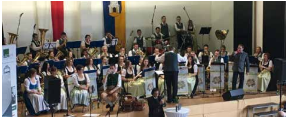
(Hinweis: Diese Fotos wurden vor den Corona-Bestimmungen aufgenommen)