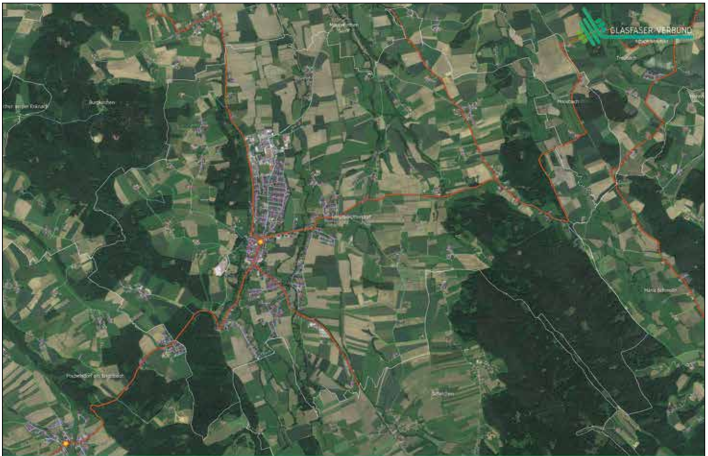
Karte der Grobplanung für die Gemeinde Helpfau-Uttendorf