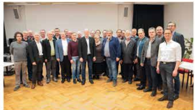
Gründung Glasfaser-Verbund Region Braunau eG

„Ein flächendeckendes Glasfasernetz wird es nur geben, wenn sich die Gemeinden in der Region zusammenschließen und mit einer Stimme sprechen“, ist Obmann Weitgasser überzeugt.