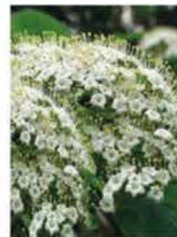
Wolliger Schneeball L / m V, cremeweiße Blüten, schöne Herbstfärbung, zuerst rote, dann schwar- ze Früchte, leicht giftig WN ..... Stk.