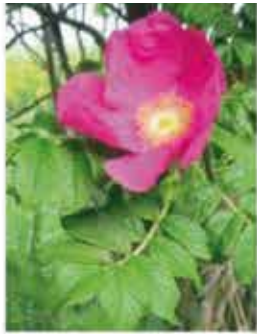
Apfelrose M, B / k V-VII, zartrosa Blüten, Früchte: Hagebutten nach Apfel duftend, besitzt Stacheln WN ..... Stk.