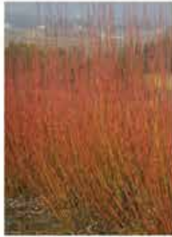
Purpurweide L / m-g eignen sich gut zum Binden und als Ufer- bestigung WN ..... Stk.