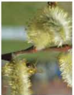
Palmkätzchen Salweide L / m-g III-IV, sehr wichtige Bie- nenweide WN ..... Stk.