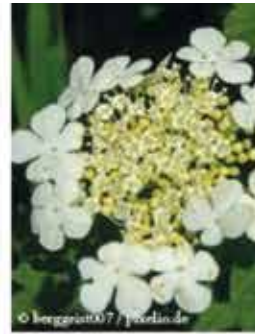
Gemeiner Schneeball L / m IV-V, oranges Herbstlaub, rote, dekorative Früchte - leicht giftig WN ..... Stk.