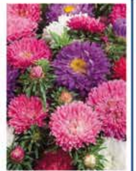
Zwergaster 60/80 cm im Container 6,00 € .....Stk.