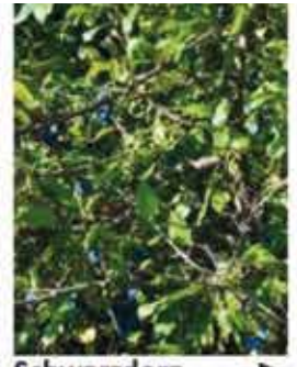
Schwarzdorn Schlehe B, M / k-m IV, weiße Blüten, zieren- de essbare Früchte, sehr anspruchlos WN ..... Stk.