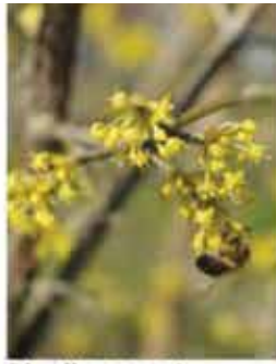
Dirndl M, L, B / m Kornelkirsche III (vor den Blättern), gelbe Blüte, gelbes Herbstlaub, vitaminreiche Früchte WN ..... Stk.