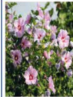
Hibiskus 13,00 € .....Stk.