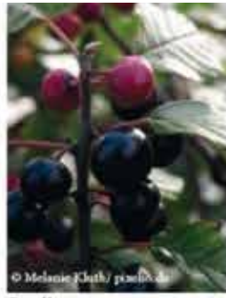
Faulbaum m-g V-VII, rote bis schwarze Beeren, leicht giftig WN ..... Stk.