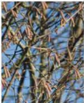
Haselnuss L II-III, goldgelbe Blüten, gelbes Herbstlaub, essbare Früchte WN ..... Stk.