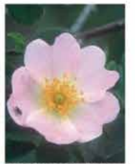
Hundsröse B, M / k VI-VIII, rosa Blüten, rote Einzelfrüchte (Hage- butten), besitzt Stacheln, leicht duftend WN ..... Stk.