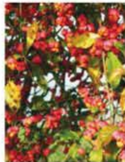
Pfaffenkapperl Spindelstrauch L / m V, oranges bis knallrotes Herbstlaub, rosarot-oran- ge Früchte, giftig WN ..... Stk.