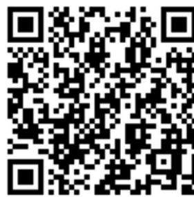
QR-Code für Android