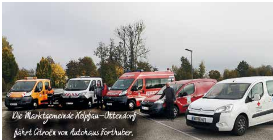
Die Marktgemeinde Helpfau-Ottendorf fährt Citroën von Autohaus Forthuber.