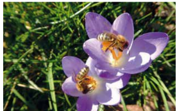
Abb. 2: Bienen auf Krokusse