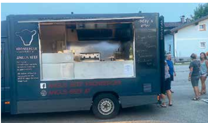
Für das leibliche Wohl sorgte reichlich Fa. Kronberger mit dem Angus Beef Bus

Der gemütliche Teil fand am Parkplatz vor dem Schützen Vereinslokal statt.