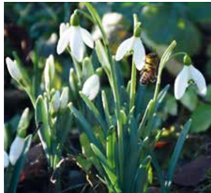
Abb.1: Schneeglöckchen, Foto: Gerlinde Larndorfer

bot zu regelrechten Nahrungsquellen für die Bienen werden. Daher ist es besonders wichtig, bereits jetzt im Herbst für den Frühling vorzusorgen, indem man beispielsweise Blumenzwiebeln einpflanzt. Einige Frühblüher, welche von der Pflanzung bis hin zur Pflege sehr anspruchslos sind, sind zum Beispiel Schneeglöckchen, Winterlinge, Blaustern, Frühlingskrokus, Traubenzhyazinthe oder Lungenkraut.