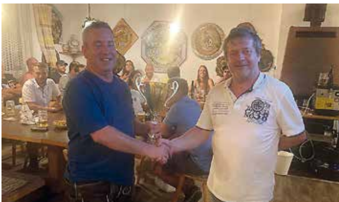
der als Preis einen Pokal überreicht bekam.