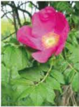
Apfelrose M, B / k V-VII, zartrosa Blüten, Früchte: Hagebutten nach Apfel duftend, besitzt Stacheln WN ..... Stk.