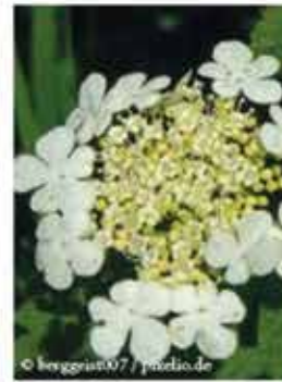
Gemeiner Schneeball L / m IV-V, oranges Herbstlaub, rote, dekorative Früchte - leicht giftig WN ..... Stk.