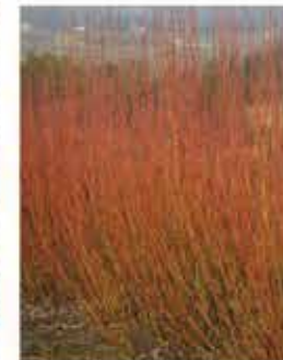
Purpurweide L / m-g eignen sich gut zum Binden und als Ufer- bestigung WN ..... Stk.