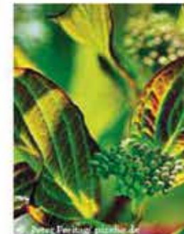
Roter Hart- riegel L / k-m V-VI, rote Herbstfärbung, rote Zweige im Winter, roh leicht giftig WN ..... Stk.