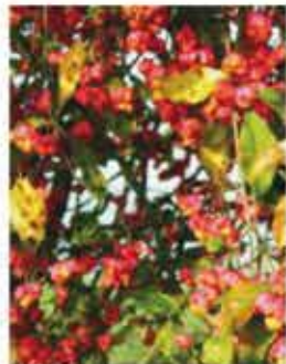
Pfaffenkappel Spindelstrauch L / m V, oranges bis knallrotes Herbstlaub, rosarot-oran- ge Früchte, giftig WN ..... Stk.