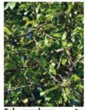
Schwarzdorn Schlehe B, M / k-m IV, weiße Blüten, zieren- de essbare Früchte, sehr anspruchlos WN ..... Stk.