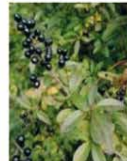
Liguster L, m-g VI-VII, weiße, leicht duftende Blütenrispen, Blätter in milden Wintern wintergrün, glänzend schwarze, leicht giftige Früchte, sehr anpas- sungsfähig .....Stk.