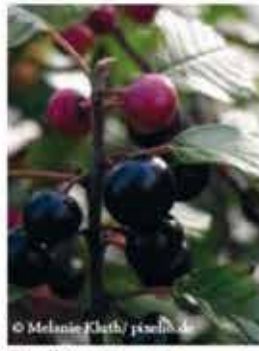
Faulbaum m-g V-VII, rote bis schwarze Beeren, leicht giftig WN ..... Stk.