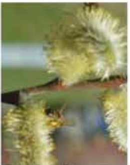
Palmkätzchen Salweide L / m-g III-IV, sehr wichtige Bie- nenweide WN ..... Stk.