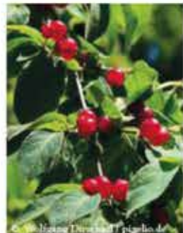
Rote Hecken- kirsche L / k-m V-VI, gelbliche bis rötli- che Blüten, rote Beeren, giftig WN ..... Stk.