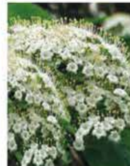
Wolliger Schneeball L / m V, cremeweiße Blüten, schöne Herbstfärbung, zuerst rote, dann schwar- ze Früchte, leicht giftig WN ..... Stk.