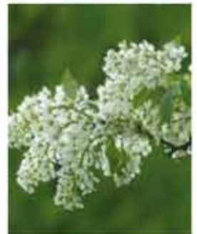
Traubenkirsche g IV-V, weiße duftende Blütentrauben, kugelige schwarze Früchte, schöne, bunte Herbstfärbung, sehr robustes Gehölz .....Stk.