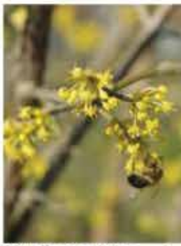
Dirndl M, L, B / m Kornelkirsche III (vor den Blättern), gelbe Blüte, gelbes Herbstlaub, vitaminreiche Früchte WN ..... Stk.