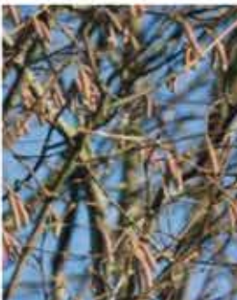
Haselnuss L II-III, goldgelbe Blüten, gelbes Herbstlaub, essbare Früchte WN ..... Stk.