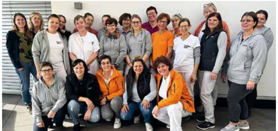
Mobile Pflegedienste der Caritas im Bezirk Braunau

Wer einen Job sucht, wo Menschlichkeit und Miteinander gelebt werden,